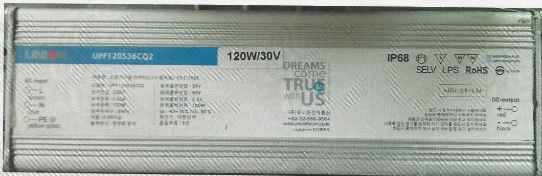
[LED 모듈 전원공급용 컨버터]