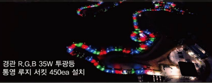
경관 R,G,B 35W 투광등 통영 루지 서킷 450ea 설치