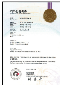
[투광등 디자인 특허]