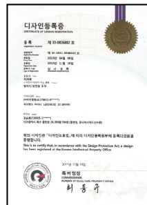
[보안등 디자인 특허]