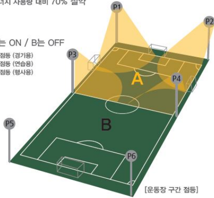
[운동장 구간 점등]

TYPE A-1 : A 구역 최대 밝기로 점등 (경기용) TYPE A-2 : A 구역 중간 밝기로 점등 (연습용) TYPE A-3 : A 구역 최소 밝기로 점등 (행사용)